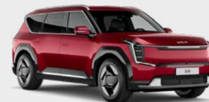
Flare Red Kleurcode: C7R Standaard (gratis) kleur