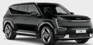
Aurora Black Pearl Kleurcode: ABP