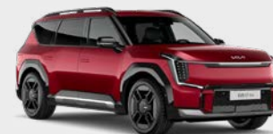
Flare Red Kleurcode: C7R