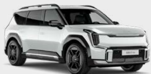
Snow White Pearl Kleurcode: SWP