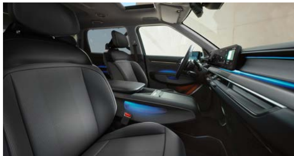
Vegan lederen bekleding - donkergrijs met zwart

Stoelzitting in donkergrijs met subtiel reliëf, het bovenste gedeelte van de rugleuning en hoofdsteun afgewerkt in het zwart. Dashboard met duurzame materialen en in donkergrijze tinten.