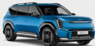
Ocean Blue Glossy Kleurcode: OBG