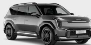
Pebble Grey Kleurcode: DFG