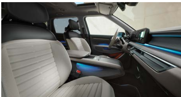
Vegan lederen bekleding - lichtgrijs met donkergrijs

Stoelzitting in lichtgrijs met gewatteerde horizontale afwerking, het bovenste gedeelte van de rugleuning en hoofdsteun afgewerkt in donkergrijs. Dashboard met duurzame materialen en lichtgrijze tinten.