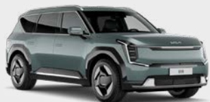
Iceberg Green Kleurcode: IEG