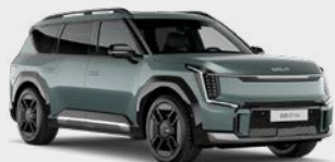
Iceberg Green Kleurcode: IEG