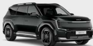
Aurora Black Pearl Kleurcode: ABP