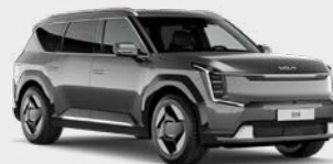
Pebble Grey Kleurcode: DFG