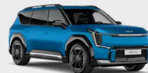
Ocean Blue Matte Kleurcode: OBG