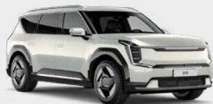
Ivory Silver Glossy Kleurcode: ISG