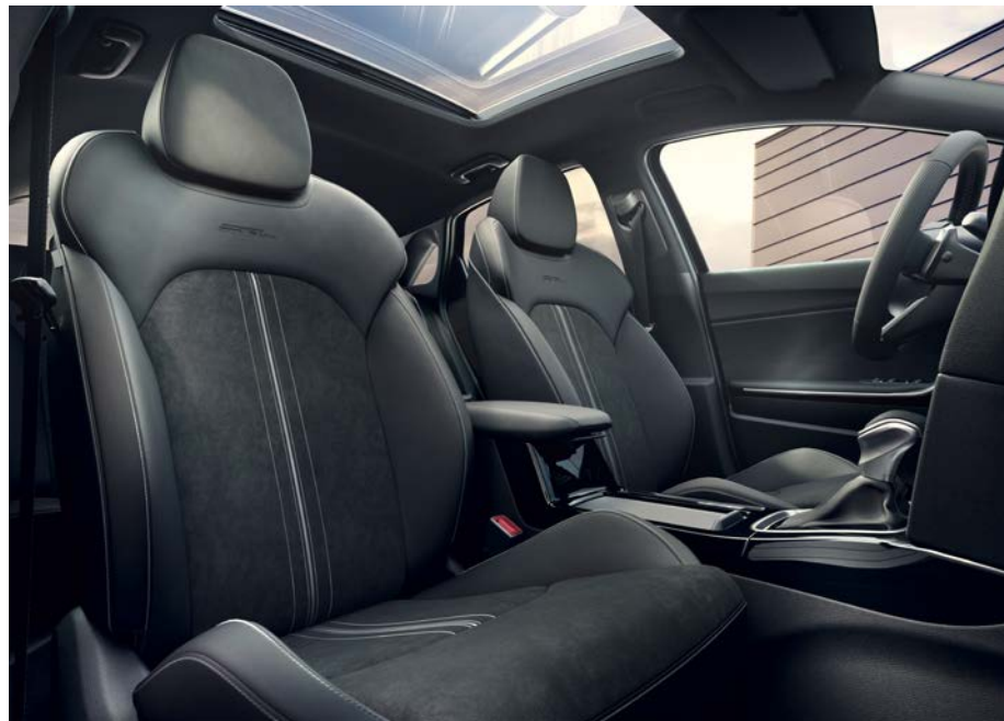
Suède sportstoelen - zwart GT-Line

Stoelbekleding in suède met lederlook. Bovenste gedeelte van de stoelen en de hoofdsteunen afgewerkt in lederlook met herkenbaar GT-Line logo. Stoelzitting en rugleuning afgewerkt in suède.