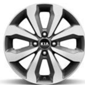
16" lichtmetalen velg M