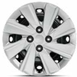
15" stalen velg S