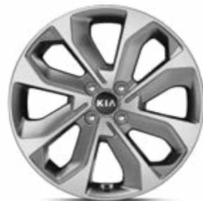
17" lichtmetalen velg M (enkel als accessoire verkrijgbaar)