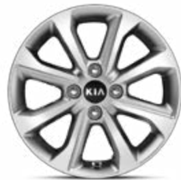
15" lichtmetalen velg M