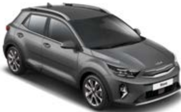
Astro Grey _ M7G