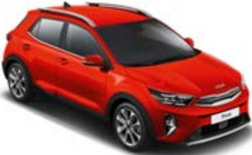
Signal Red _ BEG