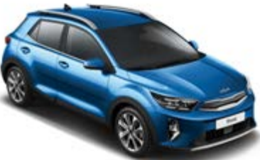
Sporty Blue _ SBP