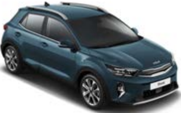
Smoke Blue _ EU3