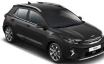
Aurora Black Pearl _ ABP