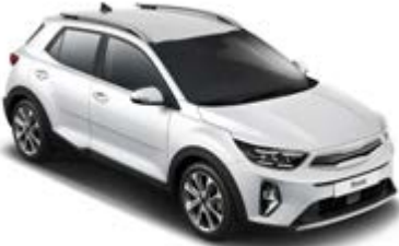
Clear White _ UD