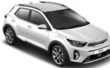
Snow White Pearl _ SWP