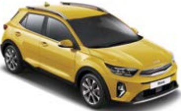
Honey Bee _ B2Y