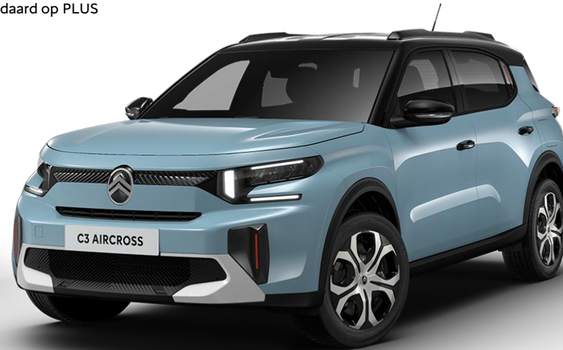
17" stalen velgen 'Sylvanite' Standaard op PLUS