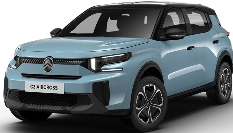
16" stalen velgen met wielpop 'Titanite' Standaard op YOU