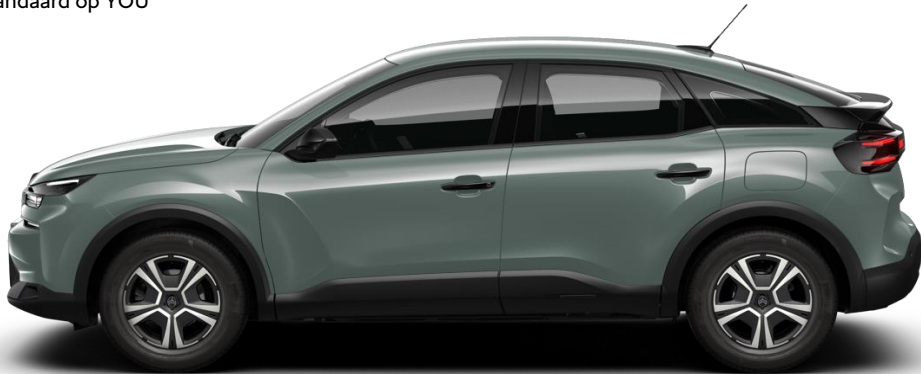
16" stalen velgen met wioldop 'Thor' standaard op YOU