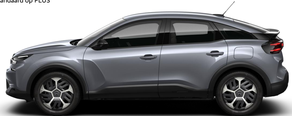
18" stalen velgen 'Aerotech' standaard op PLUS