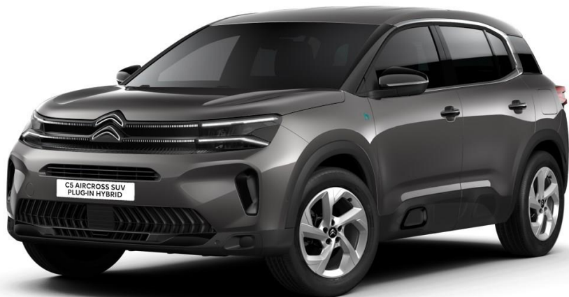
18" lichtmetalen velgen 'Swirl' Standaard op PLUS