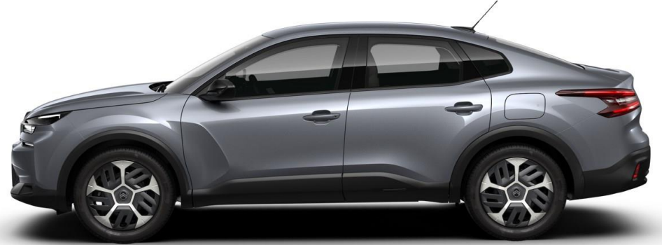
18" stalen velgen 'Aerotech' standaard op PLUS