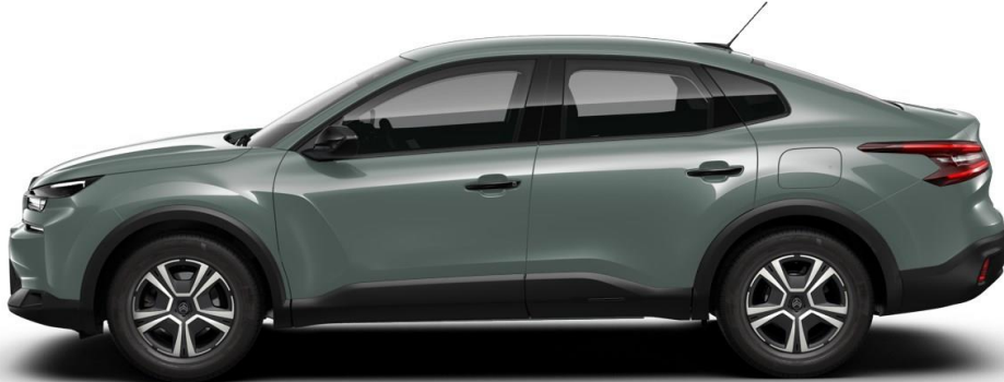
16" stalen velgen met wioldop 'Thor' standaard op YOU