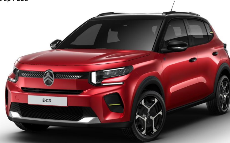
17" stalen velgen met wioldop 'Azurite' Standaard op PLUS