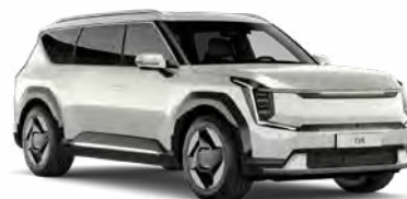
Ivory Silver Glossy Kleurcode: ISG