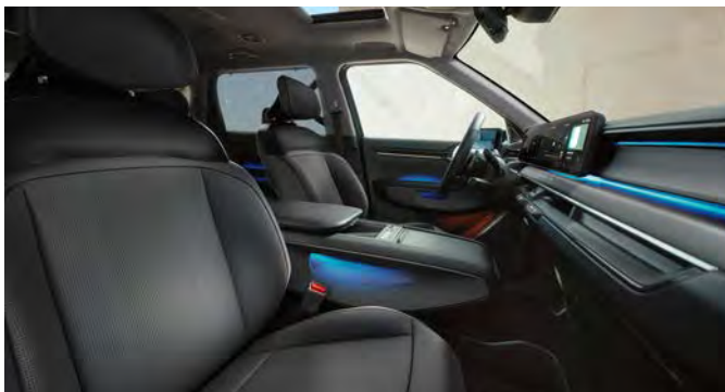
Vegan lederen bekleding - donkergrijs met zwart

Stoelzitting in donkergrijs met subtiel reliëf, het bovenste gedeelte van de rugleuning en hoofdsteun afgewerkt in het zwart. Dashboard met duurzame materialen en in donkergrijze tinten.