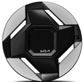
19" lichtmetalen velgen (255/60R19 V) Standaard voor First Edition, Air, Plus uitvoeringen