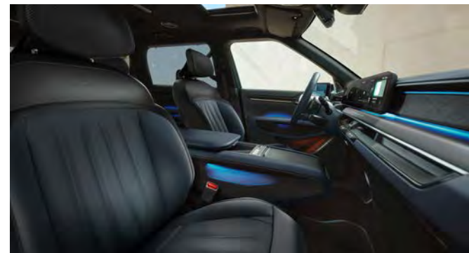
Vegan lederen bekleding - GT-Line Navy

Stoelzitting in navy met GT-Line logo's, het bovenste gedeelte van de rugleuning en hoofdsteun afgewerkt in donkergrijs. Dashboard met duurzame materialen en in donkergrijze tinten met Navy details.