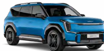
Ocean Blue Glossy Kleurcode: OBG