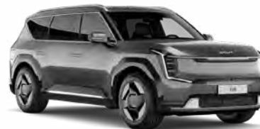
Pebble Grey Kleurcode: DFG