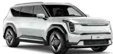
Snow White Pearl Kleurcode: SWP