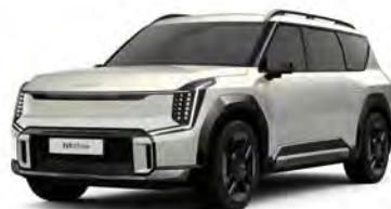
Matte Ivory Silver Kleurcode: ISM