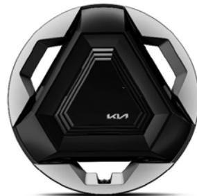
20" lichtmetalen velgen (275/50R20 V) Standaard voor Plus Advanced uitvoeringen