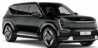
Aurora Black Pearl Kleurcode: ABP