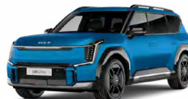
Matte Ocean Blue Kleurcode: OBM