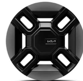
21" lichtmetalen velgen (285/45R21 V) Standaard voor GT-Line uitvoeringen