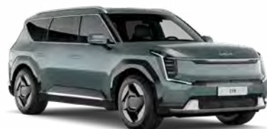
Iceberg Green Kleurcode: IEG