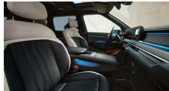
Vegan lederen bekleding - GT-Line zwart met lichtgrijs

Stoelzitting in zwart met GT-Line logo's, het bovenste gedeelte van de rugleuning en hoofdsteun afgewerkt in lichtgrijs. Dashboard met duurzame materialen en in donkergrijze tinten.