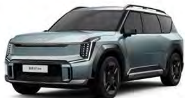
Matte Iceberg Green Kleurcode: IEB