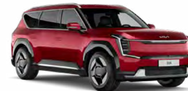
Flare Red (standaard kleur) Kleurcode: C7R