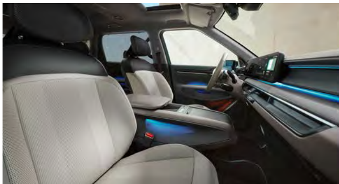
Vegan lederen bekleding - lichtgrijs met donkergrijs

Stoelzitting in lichtgrijs met subtiel reliëf, het bovenste gedeelte van de rugleuning en hoofdsteun afgewerkt in het donkergrijze. Dashboard met duurzame materialen en in lichtgrijze tinten.