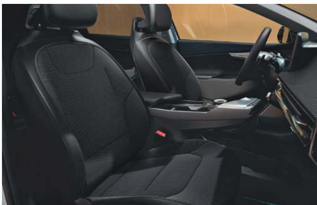
Stof/vegan leder combinatie

Stoelzitting in donkergrijs met subtiel reliëf, het bovenste gedeelte van de rugleuning en hoofdsteun afgewerkt in het zwart. Dashboard met duurzame materialen en in donkergrijze tinten.