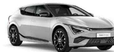
Wolf Grey Kleurcode: C7S