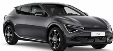
Interstellar Grey Kleurcode: AGT