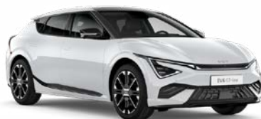
Snow White Pearl Kleurcode: SWP