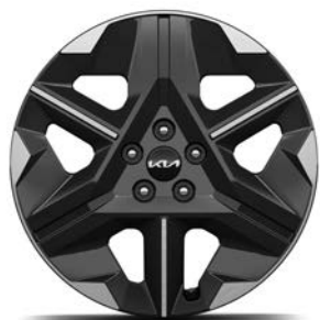
19" lichtmetalen velgen (235/55 R19) Standaard voor Light Edition, Air en Plus 63kWh