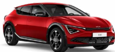
Runway Red Kleurcode: CR5

Beschikbaar op Light Edition / Air / Plus / Plus Advanced.