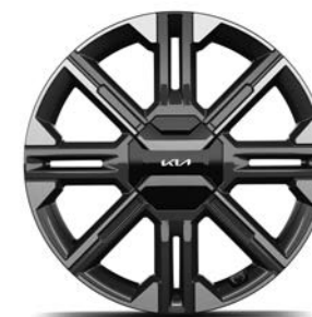
20" lichtmetalen velgen (255/45 R20) Standaard voor GT-Line