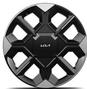
20" lichtmetalen velgen (255/45 R20) Standaard voor Plus 84kWh en Plus Advanced