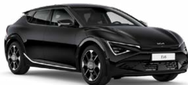
Aurora Black Pearl Kleurcode: ABP