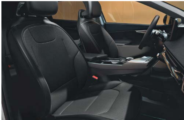
Vegan lederen bekleding - zwart

Stoelzitting in zwart met gewatteerde horizontale afwerking, het bovenste gedeelte van de rugleuning en hoofdsteun afgewerkt in het zwart. Dashboard met duurzame materialen en in donkergrijze tinten.