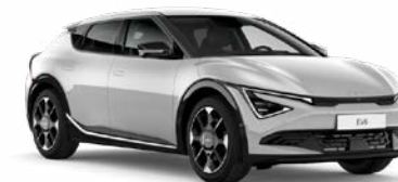
Wolf Grey Kleurcode: C7S