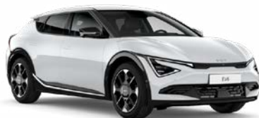
Snow White Pearl Kleurcode: SWP