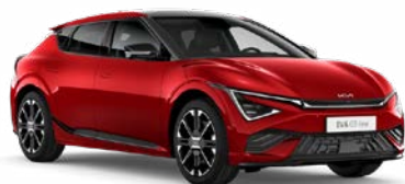
Runway Red Kleurcode: CR5