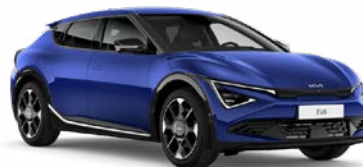
Yacht Blue Kleurcode: DU3