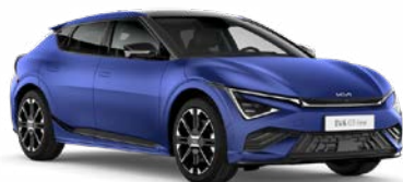
Yacht Blue Matte Kleurcode: DUM