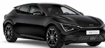
Aurora Black Pearl Kleurcode: ABP