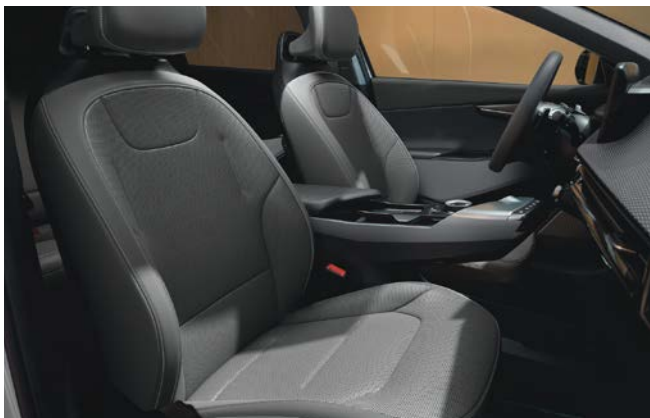
Vegan lederen bekleding - lichtgrijs met donkergrijs

Stoelzitting in lichtgrijs met subtiel reliëf, het bovenste gedeelte van de rugleuning en hoofdsteun afgewerkt in donkergrijs. Dashboard met duurzame materialen en in lichtgrijze tinten.