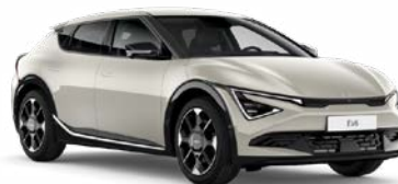
Glacier Kleurcode: GLB