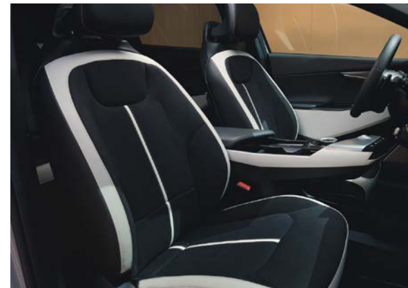
GT-Line design in suède/vegan leder combinatie - GT-Line

Stoelzitting in suède met GT-Line logo's.