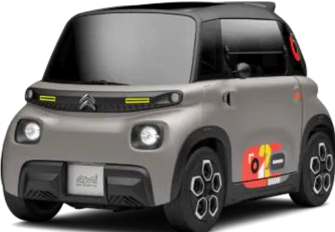
My Ami Peps € 0