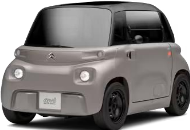
My Ami Ami € 0