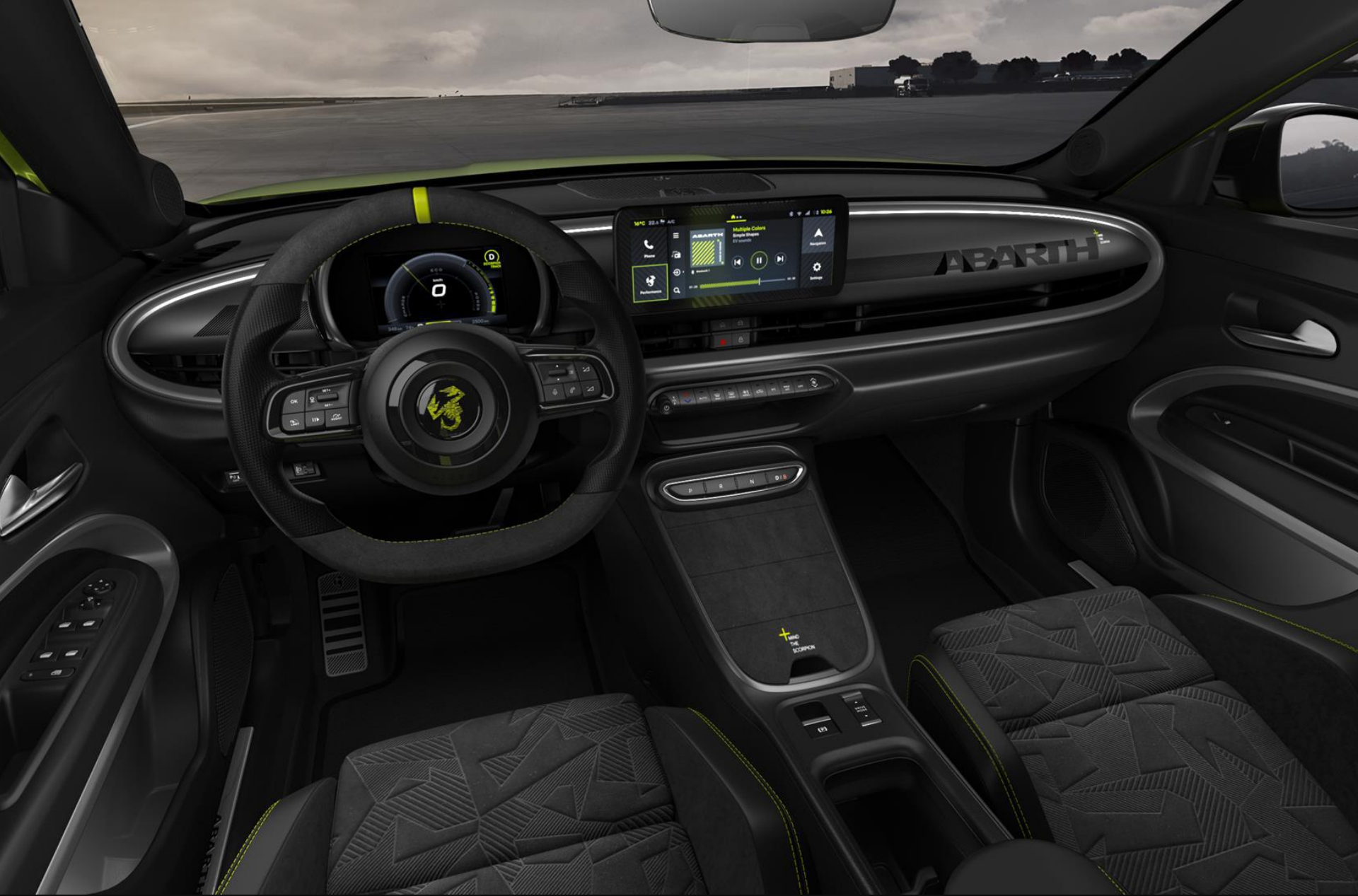
SCORPIONISSIMA | INTERIEUR