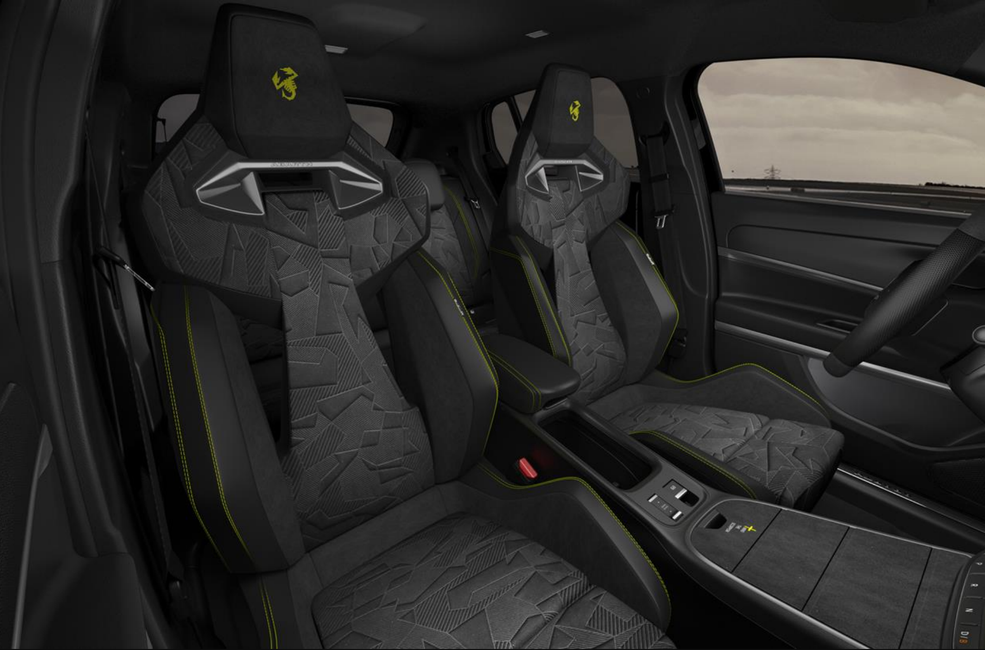
SCORPIONISSIMA | INTERIEUR