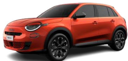
ARANCIO - SUN