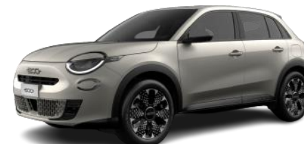
SABBIA - EARTH