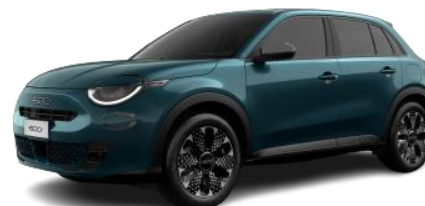
VERDE - SEA