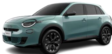
AZZURRO - SKY