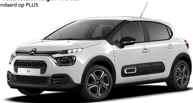
16" lichtmetalen velgen 'X-cross' Standaard op PLUS